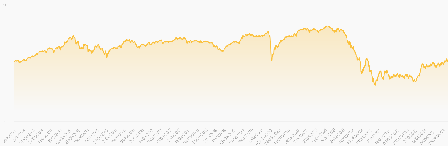
● CORE Balanced Conservative